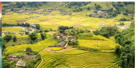
หมู่บ้านต่าฟาน

*กรณีห้องพักรับมาฮิลล์เต็ม ขอสงวนสิทธิ์ในการเปลี่ยนวันเข้าพัก และปรับเปลี่ยนโปรแกรมโดยคำนึงถึงผลประโยชน์ลูกค้าเป็นสำคัญ