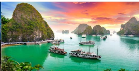
ล่องเรือชมอ่าวฮาลอง