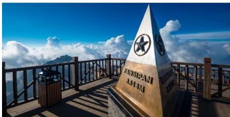
ยอดเขาฟานซีปัน