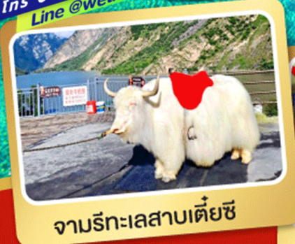
จามรีทะเลสาบเตี้ยซี