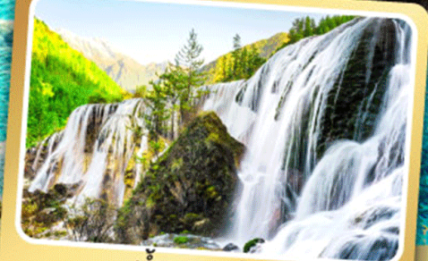
น้ำตกธารไ่่มุก

ชมโชว์เปลี่ยนหน้ากาก เมนูพิเศษ สุกหมาล่าเสฉวน