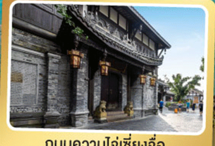
ถนนควานโจ้เซียงจื่อ