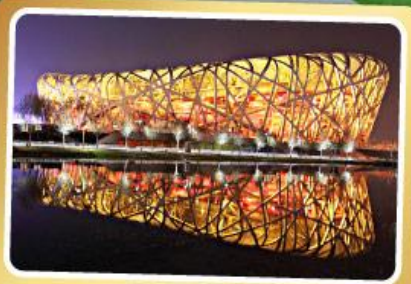
สนามกีฬาฟาริงก