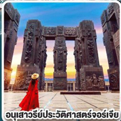
อนุสาวรีย์ประวัติศาสตร์จอร์เจีย