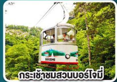
กระเช้าชมสวนบอร์โจมี