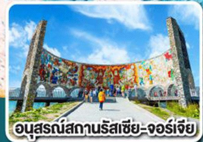
อนุสรณ์สถานรัสเซีย-จอร์เจีย