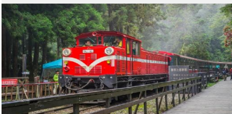
อุทยานแห่งชาติอาลีซาน