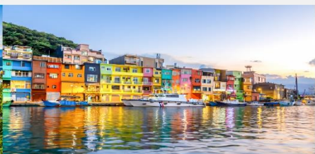
ท่าเรือประมงเจิ้งปิ่น

*ทางบริษัทฯ ขอสงวนสิทธิ์ในการสลับโปรแกรมทัวร์ตามความเหมาะสมขึ้นอยู่กับสถานการณ์หน้างาน โดยคำนึงถึงผลประโยชน์ของลูกค้าเป็นสำคัญ