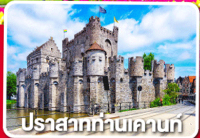
ปราสาทท่านเคานท์