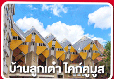
บ้านลูกเต่า โค้กคูมูส