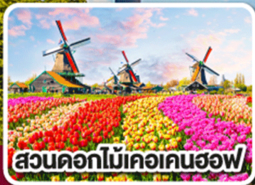
สวนดอกไม้เคอเคนฮอฟ

ดอกไม้ที่สดใส กับ หัวใจที่เปิดบาน ฝรั่งเศส เบลเยียม ลักเซมเบิร์ก เยอรมนี เนเธอร์แลนด์ 8 วัน 6 คืน