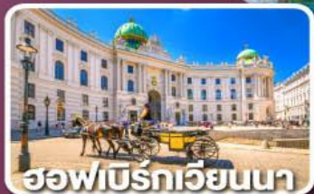
ฮอฟเบิร์กเวียนนา

ตามรอยซีรีส์ Crash Landing on you ที่ทะเลสาบเบรียนซ์