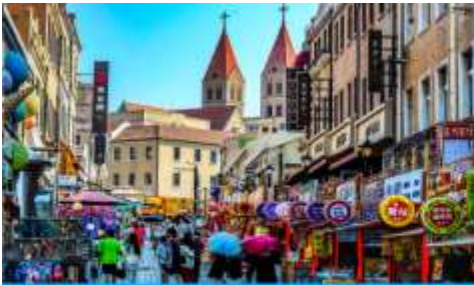
ถนนจางซาน