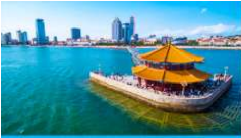
สะพานเกียนเฉียว