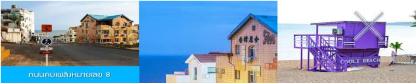
ถนนคบเพลิงหมายเลข 8