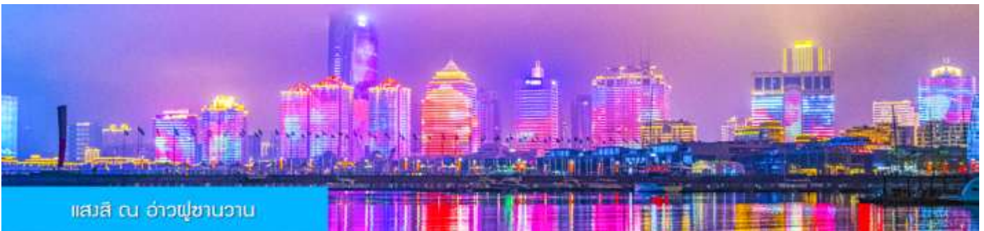
แสงสี ณ อ่าวฟูซานวาน

ค่ำ รับประทานอาหารค่ำ ณ ภัตตาคาร *เมนูซีฟู้ด (3)