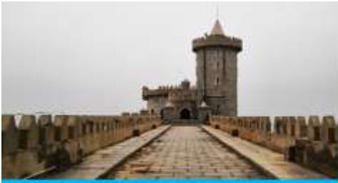
คาเฟ่อัสดง