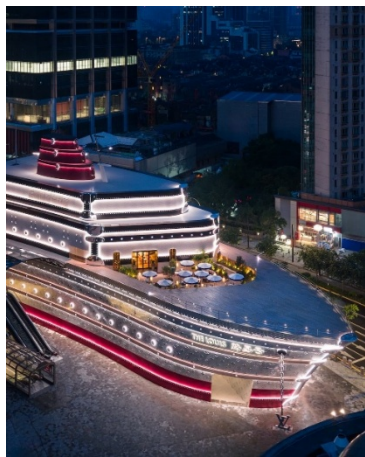
บ๊อคส์เท่านั้น

และที่พลาดไม่ได้เราสามารถมองเห็น และถ่ายรูปกับแลนด์มาร์คล่าสุดของเชียงใหม่ เรือเดอะ หลุยซ์ ร้านแฟลกชิปสโตร์ ใหม่ล่าสุดของแบรนด์เนม LV Louis Vuitton ที่เพิ่งเปิดตัวอย่างอลังการในวันที่ 28 มิถุนายนที่ผ่านมา ซึ่งทุกท่านสามารถถ่ายภาพความงดงาม อลังการและความยิ่งใหญ่ของเรือเดอะ หลุยส์ได้เพียงแค่วันหลังจากหน้าร้านสตาร์